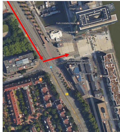
II. Einfahrt Harry-Blum-Platz

Bitte passieren Sie die Schranke und fahren parallel zum Rheinufer, bis Sie das Deutsche Sport & Olympia Museum erreichen.