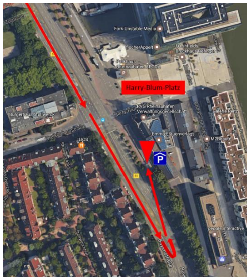
I. Einfahrt Tiefgarage

Bitte beachten Sie, dass das Museum nur über die Tiefgarage „Rheinauhafen“ in Fahrtrichtung Innenstadt erreichbar ist (siehe Foto I).